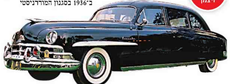
הלינקולן של ויצמן

אחד הסיורים שאסור להחמיץ נקרא "בסלון של ורה", והוא מוקדש לביקור בביתם של הנשיא הראשון חיים ויצמן ורעייתו ורה, שנמצא בתחומי המכון. כאשר הוקמה המדינה וויצמן נבחר לנשיא, עוד לא הוכשר מעון רשמי לנשיאי ישראל ובני הזוג ויצמן העדיפו להישאר בביתם. את הבית תיכנן האדריכל אריך מגדלסון ב-1936 בסגנון המודרניסטי