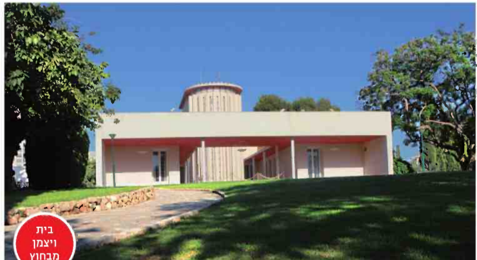
בית ויצמן מבחוץ

להסתובב בין המעבדות של הזוכים הישראלים בפרסי נובל, להציץ לביתו הפרטי של הנשיא הראשון: מכון ויצמן ברחובות מציע שורה של סיורים מעניינים • ויש גם קפה בגינה היפה