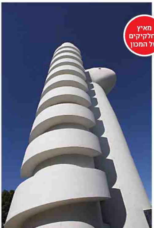
מאיץ החלקיקים של המכון

מתי? המרכז פתוח בימים א'ה', בשעות 9:00-16:00 פרטים ותיאום: טל' 08-9344499 או באתר Visitors.Center@weizmann.ac.il הרשמה: כל הסיורים מתחילים בשעה 10:00 ומשך כל סיור הוא כשעתיים. הסיורים בחינם והביקור במרכז המבקרים בחינם, אבל חובה להירשם מראש באימייל: tours.weizmann@weizmann.ac.il