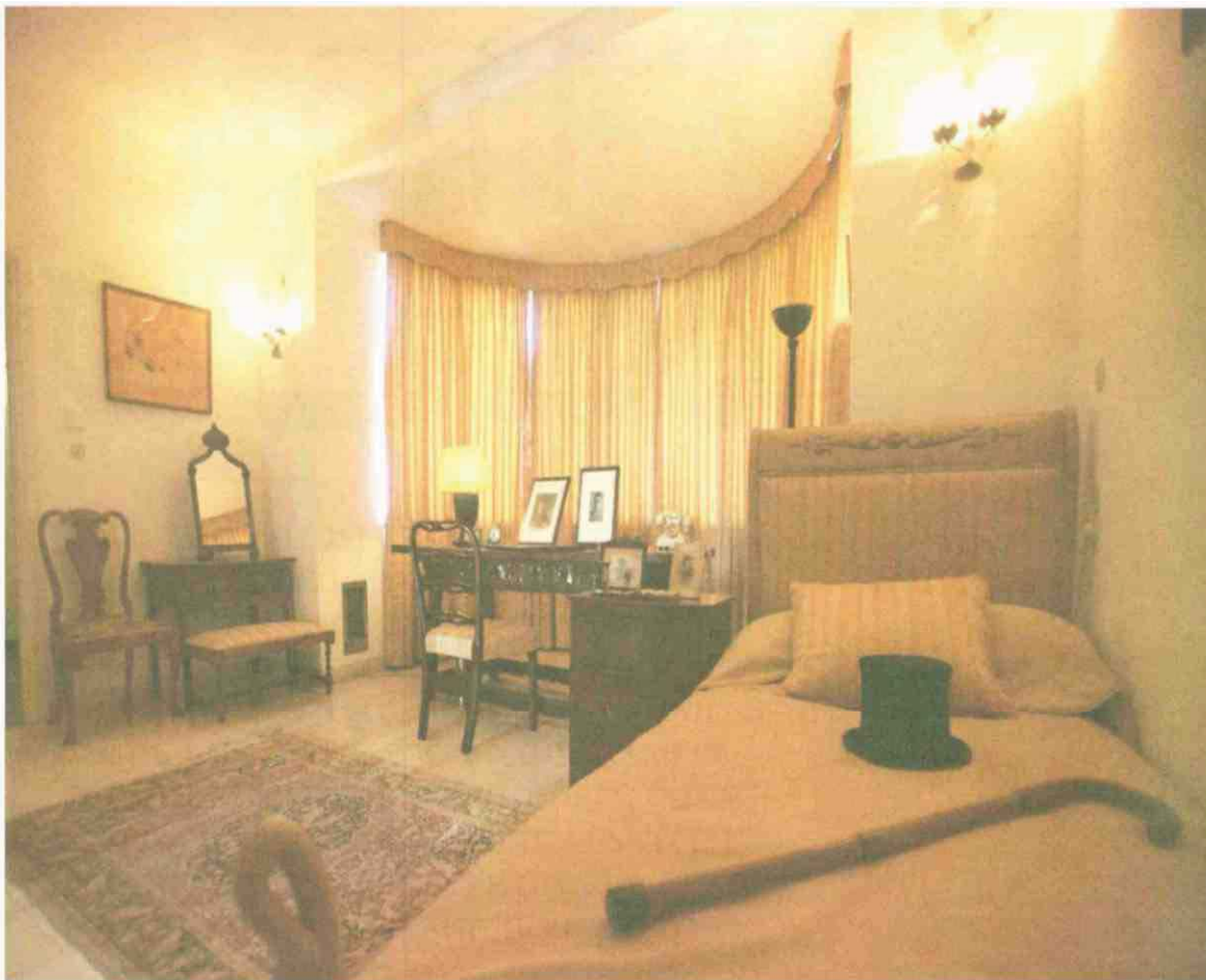
תמונות מ'בית ויצמן' המשופץ, לצד תמונות עבר